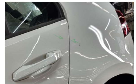
✘ Strong colour deviations