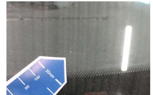
✓ Oppervlakkige pit