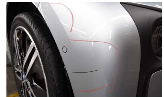
✗ Kras groter dan 4 cm, door de lak