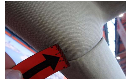
✓ oppervlakkige schade aan binnenwerk