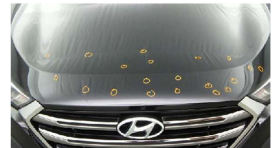
✗ Niet acceptabele steenslag