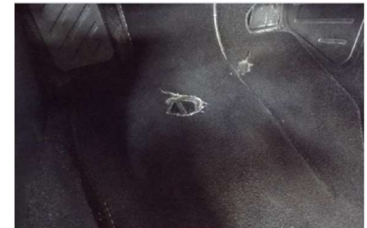
✗ Beschadigde mattenset