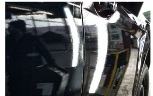
✘ Orange peel effect