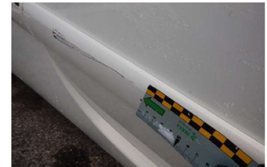
✗ Krassen >1,0 cm