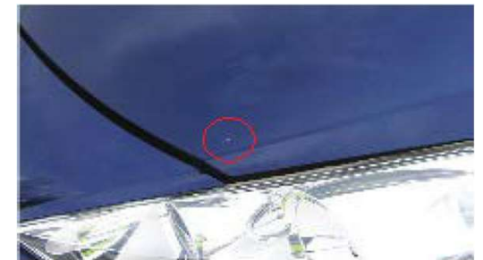
✓ Acceptabele steenslag