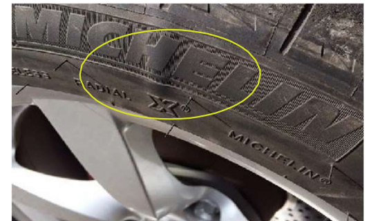
✗ Banden met scheur(en) en/ of bobble(s)