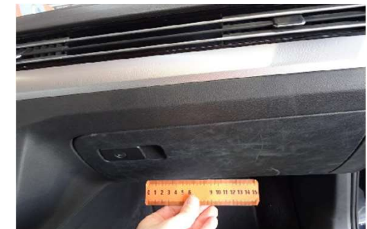
✗ Krassen aan onderdelen