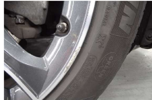
✓ Velg: 1 beschadiging tot 10,0 cm