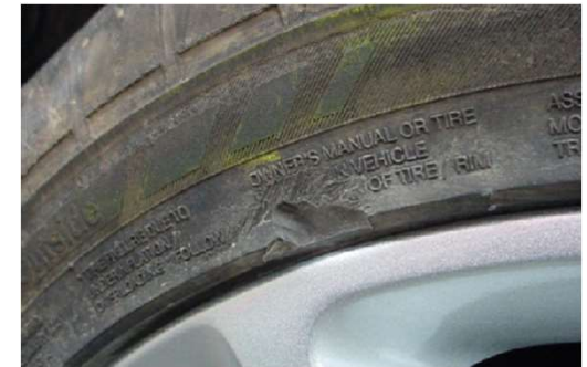
✓ Kleine beschadiging aan de zijwand

* tijdens de keuring zal er een eenmalige meting per band plaatsvinden. De meting wordt op drie plaatsen op de band uitgevoerd, in het hoofdspoor en in de schouders van de band.