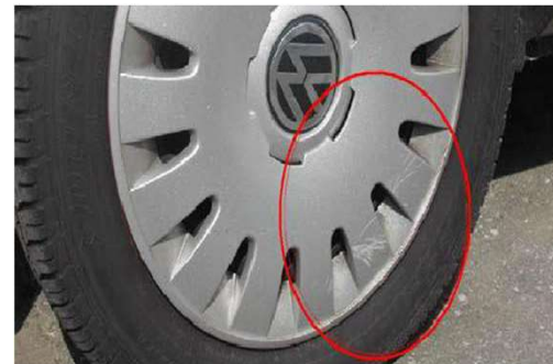
✓ Wieldop: lichte krassen <25%