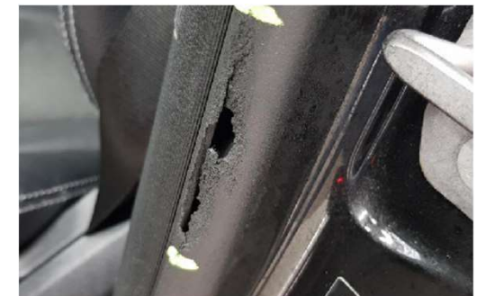
✗ Gescheurde deur afdichting