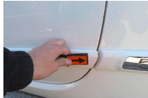
✓ Krassen <1,0 cm