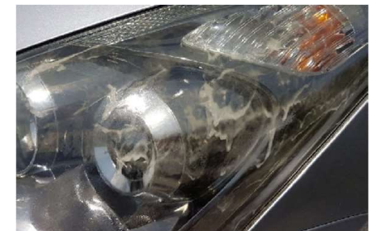
✗ Plastic kap is gebroken