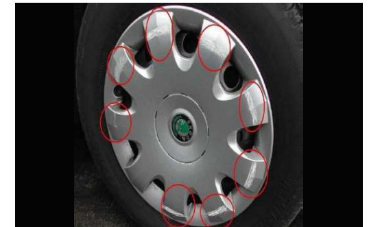
✗ Wieldop: lichte krassen >25%