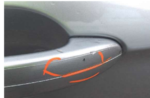
✓ Krassen tot 1,0 cm