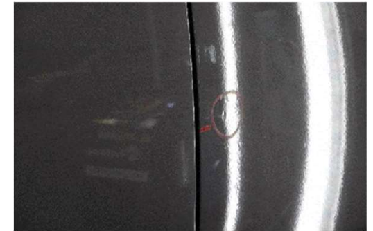
✓ Dents <2,0 cm