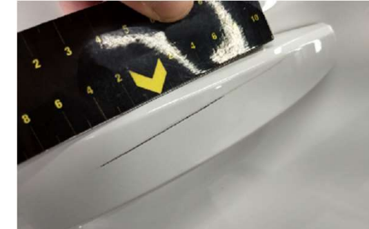
✗ Krassen groter dan 1 cm