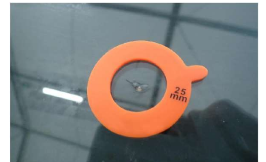
✗ Pit met tekenen van scheuren