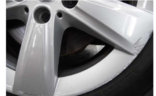
✗ Velg: schade groter dan 10 cm