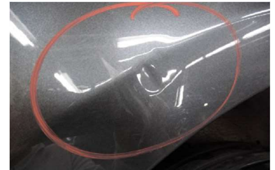
✗ Dents >2,0 cm